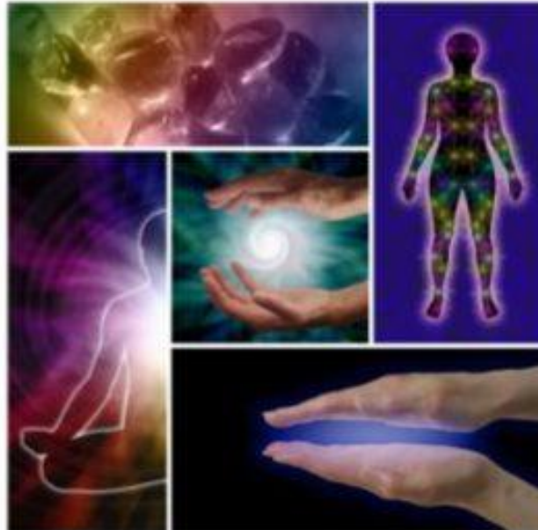
Medicina Energetica 1

Negli ultimi anni una nuova frontiera della medicina è quella che indaga i limiti del potenziale umano rispetto alla salute psicologica, fisica e alle performance ad esse correlate. È sempre più palese che i modelli di spiegazione attuali di guarigione, malattia e condizioni psico-fisiche sono insufficienti a far capire fenomeni come le guarigioni spontanee da malattie mortali, le prestazioni atletiche e artistiche di altissimo livello, le performance dei cultori delle arti marziali o le capacità psico-corporee dei praticanti le discipline contemplative e yogiche. Sembrerebbe insomma che il sistema endocrino, quello immunitario, quello circolatorio e quello nervoso non siano gli unici sistemi di informazione reattiva del corpo, ma che esista nell'organismo umano un sistema di comunicazione ad alta velocità che rileva e risponde all'ambiente energetico circostante.